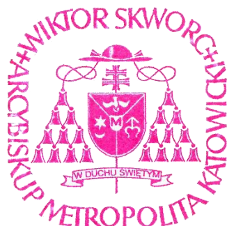
† Wiktor Skworc ARCYBISKUP METROPOLITA KATOWICKI

„Wszchemogący, wieczny Boże, otaczaj nas, podróżujących, Swoją opieką. Bądź nam w potrzebie pomocą, w drodze towarzyszem i pociechą, w przeciwnościach obroną, abyśmy za Twoim przewodnictwem, pod opieką Matki Najświętszej i św. Rafała Archanioła, pomyślnie dotarli do celu i szczęśliwie wrócili do naszych domów. Przez Chrystusa, Pana naszego”.